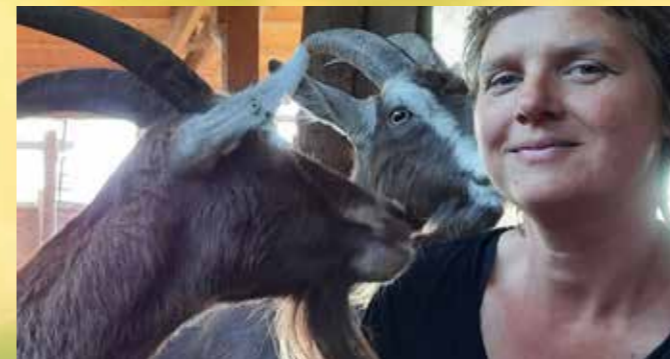
Hulp van koe, boom, mens of wolk

Dan wordt het licht op aarde en in de hemel, innerlijk en uiterlijk. Het is een levend licht. Dat heeft met veerkracht te maken. Dat lukt niet alleen, maar heeft in verbinding zijn met andere levende wezens nodig. Met de aarde, met de planten, met de dieren, met de mensen en met de engelen. Een verbinding die gelijkwaardig en wederkerig is, waar wisselwerking ontstaat, waar we bijdragen aan elkaars ontwikkeling. Die veerkracht wens ik ons allen toe in 2025 en de jaren daarna. We zullen het nodig hebben.