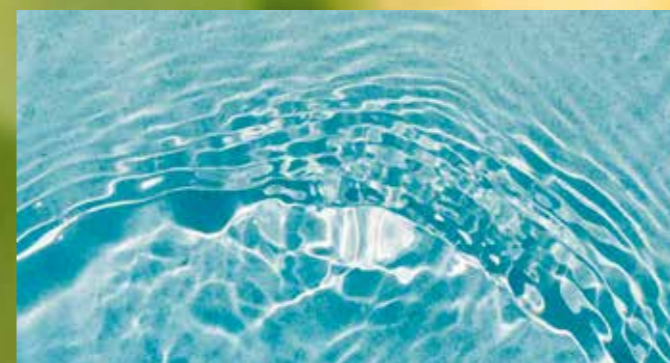
Wat delen boer en fysiotherapeut?