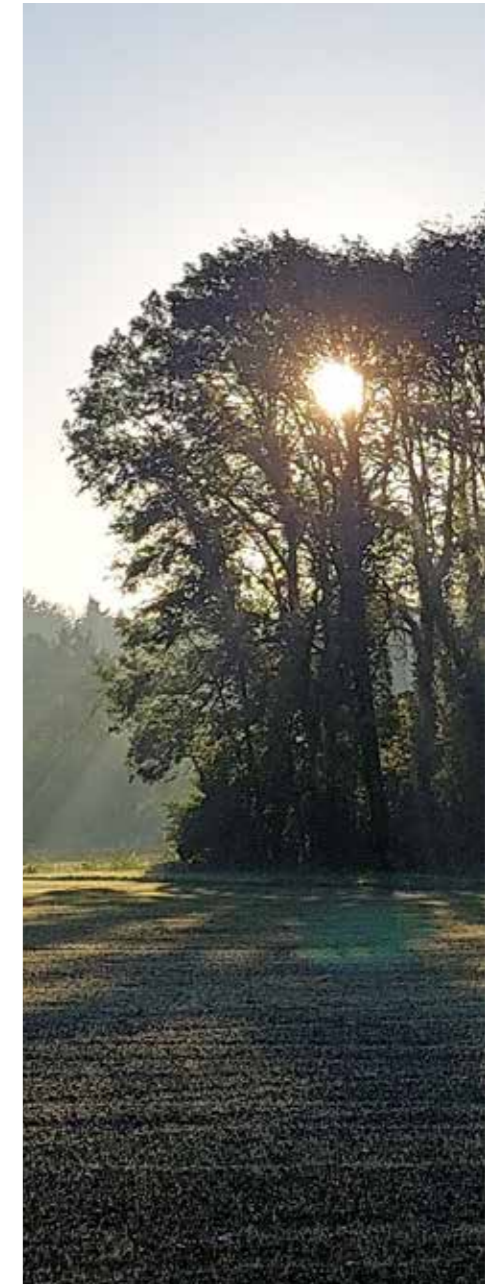
Ochtendzon op Urtica de Vijfsprong

Zij was eindverantwoordelijke bij Urtica de Vijfsprong van 2016 tot 2023. Ze is themaredacteur van deze DP, voorzitter van de Biodynamische Vereniging en ambassadeur van de Groene GGZ (zie ook ivn.nl/aanbod/groene-ggz en nahf.nl )