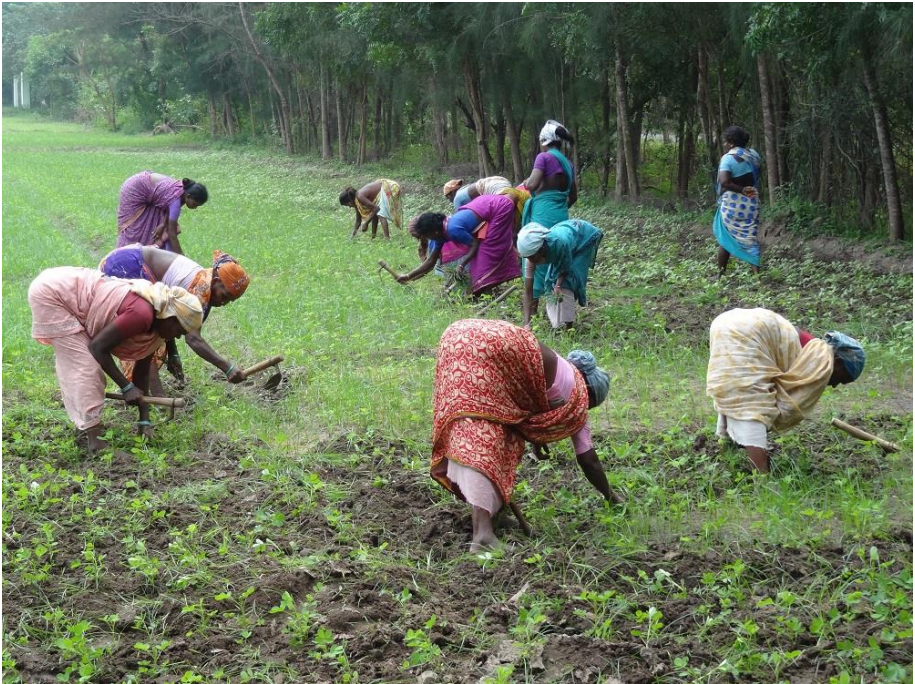
Hakken in het pindaveld op Thiru Valagum Farm.